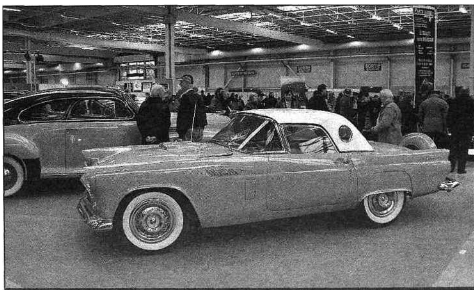
Les Américaines feront partie des invitées vedettes du Salon