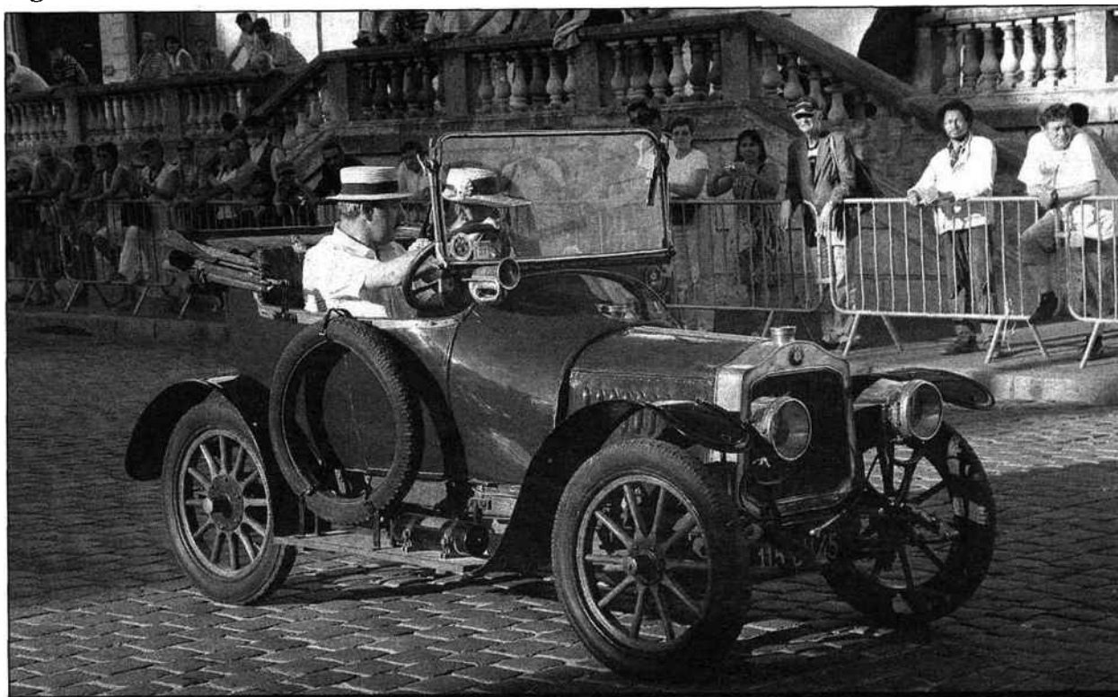
Les voitures visibles au Bourget sont racées et rares

SALON. Automédon est un événement consacré aux véhicules antérieurs à 1940. Il se déroule au Bourget les 15 et 16 octobre avec un large plateau ouvert également aux deux-roues.