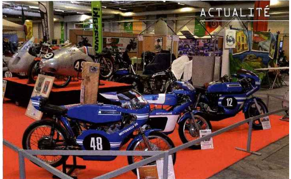
Cette enfilade de Motobécane nous rappelle le temps où les motos françaises brillaient sur les circuits.

Automédon - ORIL SARL Yves Levasseur 12 rue de Chartres 91400 Orsay organisation@automedon.fr